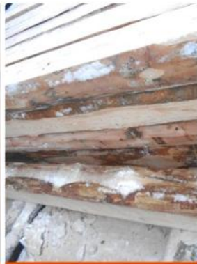
ГЕОМЕТРИЯ 3 И КОРА