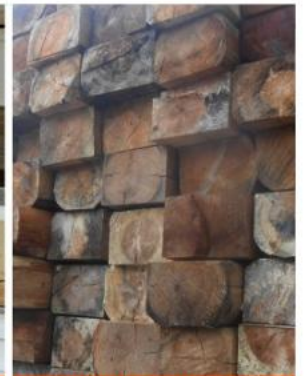
ТРЕЩИНА С ВЫХОДОМ НА ВЕРХнюю ПЛАСТЬ И ГНИЛЬ