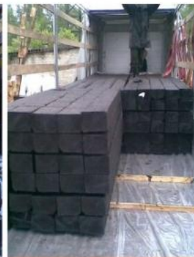
ПРАВИЛЬНАЯ ПОГРУЗКА С ПРОКЛАДКОЙ