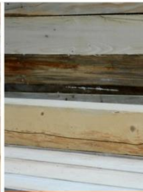
ТРЕЩИНЫ И ГНИЛЬ